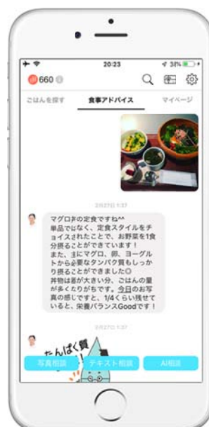
栄養士アドバイス